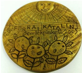
Forrai Katalin Emlékplakett 2005.