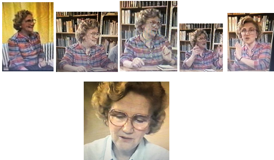
Képek a filmből