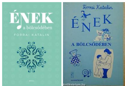
Ének a bölcsődében – 1986.

A gyermek születése pillanatától figyel, utánoz, tanul. Érdeklődve hallgatja a zenei hangokat, majd maga is hangicsálni, énekelni kezd. Az éneklés és játék öröme életre szóló élményt jelent. Mint több gyermek nevelődik bölcsődében, ezért hasznos egy olyan tájékoztató útmutató és zenei anyag, amely életkornak megfelelő, túlzásoktól mentes zenei nevelést javasol a legkisebeknek. Forrai Katalin könyve Kodály Zoltán nevelési elveire épül és kiegészítője az óvodai énekkönyvnek. A 255 dalt és mondókát is, az anya és gyermek bensőséges kapcsolatára építve, a néphagyományból válogatta össze. Az Ének a bölcsődében az Ének az óvodában című könyvhöz hasonlóan szülőknek és nevelőknek szól. A játékok és jó tanácsok hozzásegítenek ahhoz, hogy a gyerekekkel életkoruknak megfelelően foglalkozzunk. Az óvoda ugyanilyen szellemben folytatja a zenei nevelést és reméljük, hogy a sok szép élmény hatására a gyermekek zeneileg érdeklődő, kiegyensúlyozott, derűs emberré válnak.