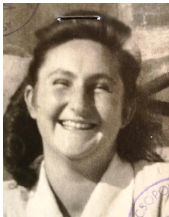
Repülési naplóból 1948. (22 éves)