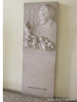
Akócsi Ágnes dombormű Bölcsőde Múzeum - 2002.újraállítva