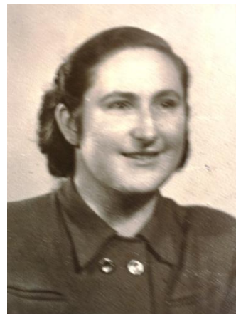
Pázmány Péter Tudományegyetem leckekönyvéből 1947. (21 éves)