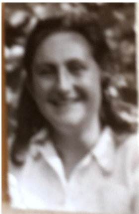
Elemi Népiskola 1933-1936 (7-10 éves)