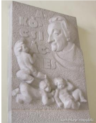
Akócsi Ágnes dombormű BOMI aula -1978. Hadik Magda